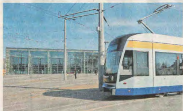
Grafik: Dagmar Schulze

Platz 10: In der LVB-Betriebswerkstatt in Heiterblick (rund 100 Mio. Euro) sollen nach dem Technischen Zentrum an der Teslastraße in einem zweiten Bauabschnitt unter anderem die Betriebswerkstatt und eine Abstellhalle neu errichtet werden. Die Fertigstellung ist nach 2020 geplant.